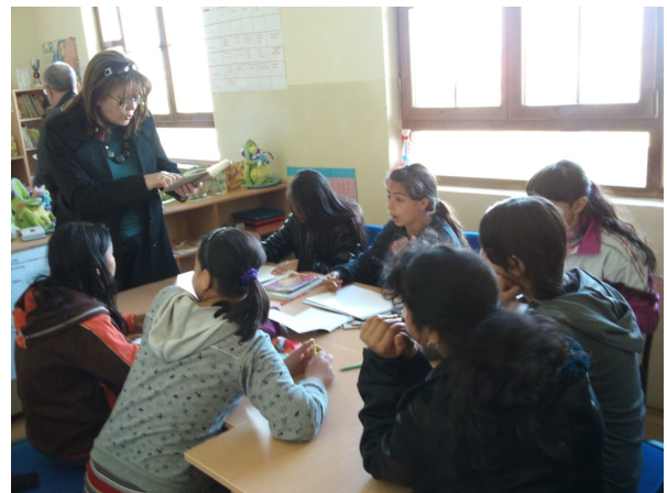
Qendra Mësimore në Graçanicë

■ Edhe në këtë muaj në mënyrë rregullt ka shkuar mbarëvajtja e aktiviteteve në qendrat mësimore. Duhet të theksohet se gjatë muajit maj dhe në fillim të muajit qershor qendrat kanë angazhuar trajner për ofrimin e ndihmës për nxënësit që do t'i nënshtrohen provimit të maturës, testit të arritshmërisë si dhe provimit pranues në institucionet e larta arsimore.