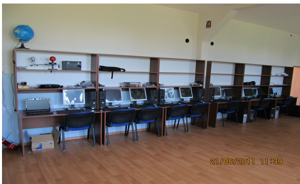
Shkolla "Z.L.Marku" në Brekoc

■ Gjatë muajit qershor, bashkëpunëtorët profesional të terrenit kanë ndihmuar 114 shkollat përfituese të rundit të parë që të respektojnë procedurat e prokurimit dhe të kompletojnë dokumentet e nevojshme, si parakusht për të marrë aprovimin nga Ekipi Koordinues i Projektit në MASHT për nënshkrimin e kontratave me kompanitë fituese. Si rezultat i punës së BPT shumë shkolla kanë arritur që të nënshkruajnë kontratat me kompanitë përfituese dhe të pranojnë mallrat dhe shërbimet e kontraktuara.